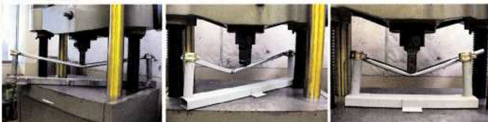
写真 1 (1,200mm)